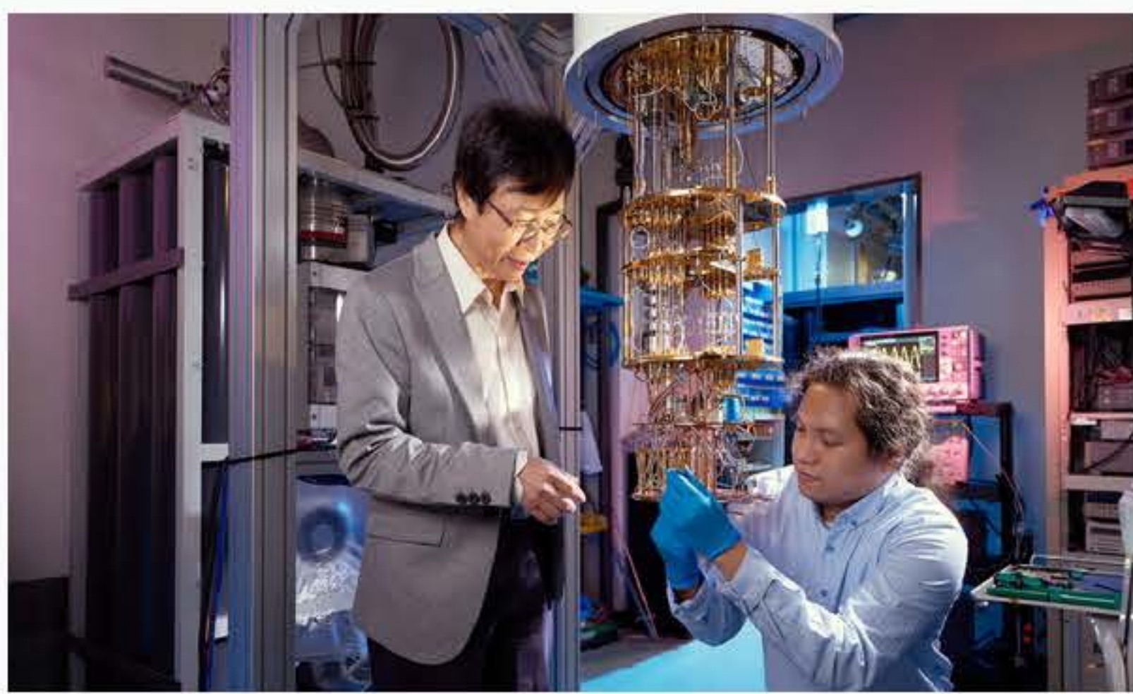
中央研究院自研自製5位元超導量子電腦連線上網